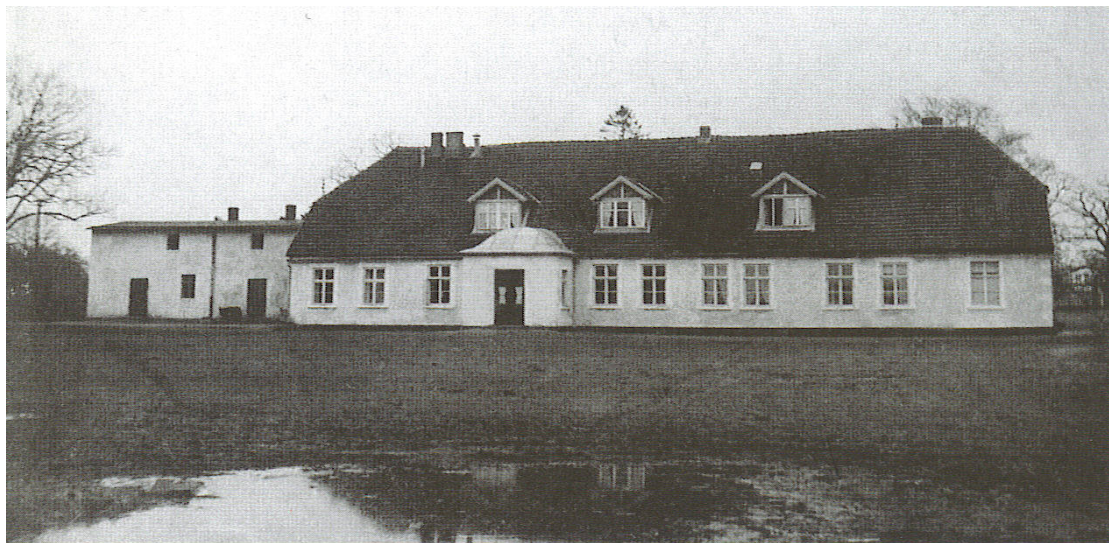
Inspektorenhaus auf dem Sandhof