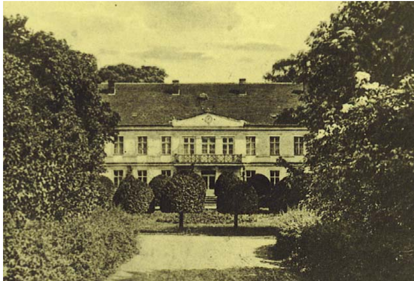
Ausschnitt aus einer Ansichtskarte von etwa 1925